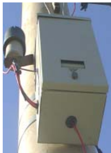
TABLERO DE COMANDO PILOTOS