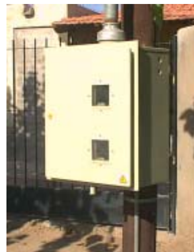
MEDICIÓN DE 2 HILOS PILOTOS