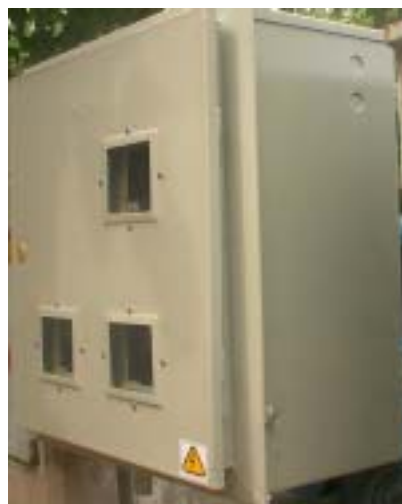
MEDICIÓN DE 3 HILOS PILOTOS