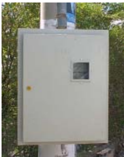
MEDICIÓN DE 1 HILO PILOTO